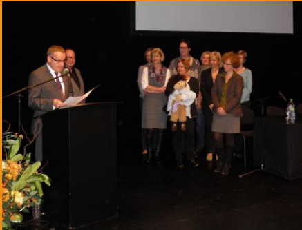
Preisverleihung im Mousonturm, Frankfurt