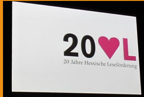
20 Jahre Hessische Leseförderung

Dass sich das Leseförderungskonzept tatsächlich zu unserem Aushängeschild gemausert hat, kann man daran ablesen, dass 70 Prozent der 8- bis 11-jährigen Kinder im letzten Jahr Medien in der Stadtbibliothek ausgeliehen haben. Hier zeigt sich auch, wie wichtig es ist, konzeptionell zu arbeiten und sich an zuvor festgelegten Zielen und Maßnahmen zu orientieren. Seit Erstellung unseres ersten Bibliothekskonzeptes 2008/2009 haben wir konsequent unser Leseförderprogramm ausgebaut. Führten wir ursprünglich ein Dutzend Klassenführungen pro Jahr durch, haben wir 2014 im Rahmen von 51 Führungen 1.056 Kinder und Jugendliche in die Bibliotheksnutzung eingeführt sowie 45 Bücherkisten ausgeliehen. Durch weitere Aktionen konnten wir nochmals über 900 Kinder und Jugendliche erreichen.