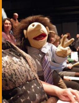
Nicki war auch dabei!